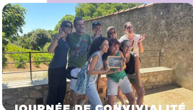
JOURNÉE DE CONVIVIALITÉ