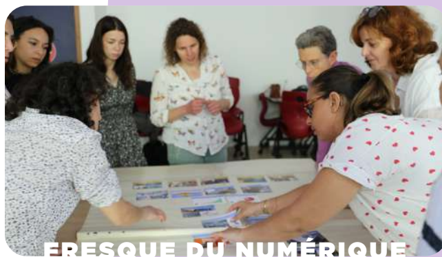
FRESQUE DU NUMÉRIQUE

La marque montpelliéraine à impact et atelier d' upcycling Silibiliz a été sollicitée pour donner une seconde vie aux kakémonos devenus obsolètes. Recyclés et transformés en petites pochettes, ils permettent au personnel de conserver un souvenir concret de ces supports de communication tout en valorisant la réutilisation de matériaux existants.