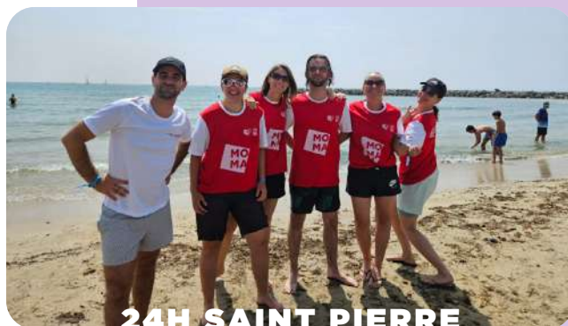
24H SAINT PIERRE